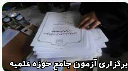
برگزاری آزمون جامع حوزه علمیه