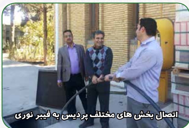
اتصال بخش های مختلف پردیس به فیبر نوری