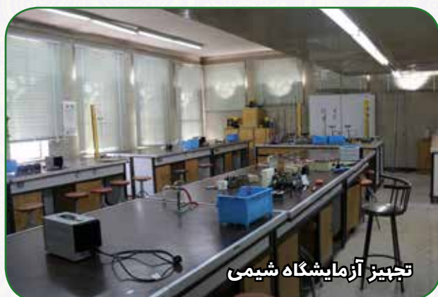
تجهیز آزمایشگاه شیمی