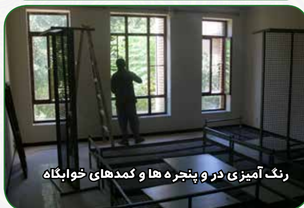
رنگ آمیزی در و پنجره ها و کمد های خوابگاه