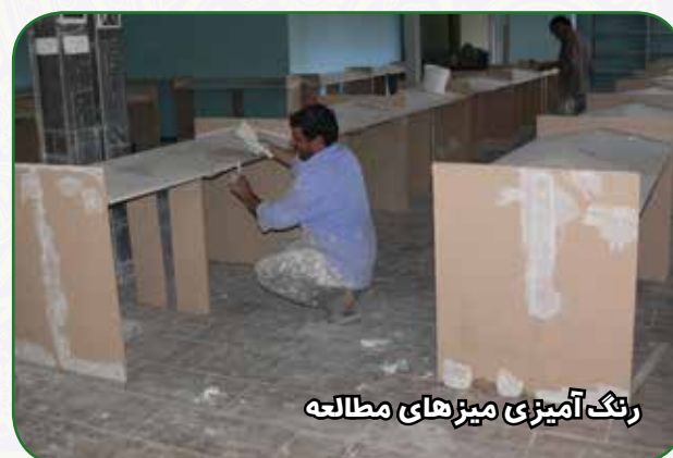
رنگ آمیزی میزهای مطالعه