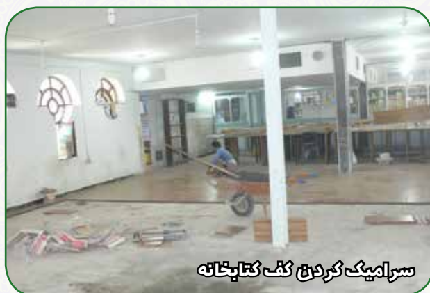
سرامیک کردن کف کتابخانه

بهسازی و زیباسازی فضای بیرونی و درونی ساختمان اداری