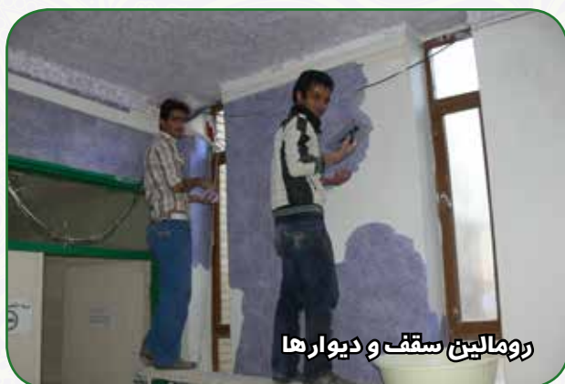
رومالین سقف و دیوارها