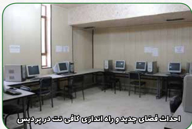
احداث فضای جدید و راه اندازی کافی نت در پردیس