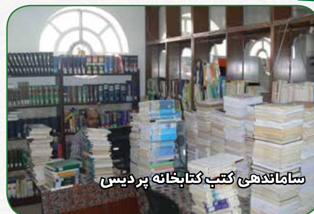
ساماندهی کتب کتابخانه پردیس