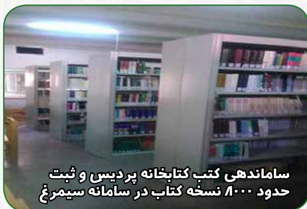
ساماندهی کتب کتابخانه پردیس و ثبت حدود ۱۰۰۰ نسخه کتاب در سامانه سیمرغ