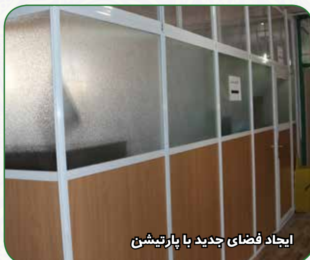
ایجاد فضای جدید با پارتیشن