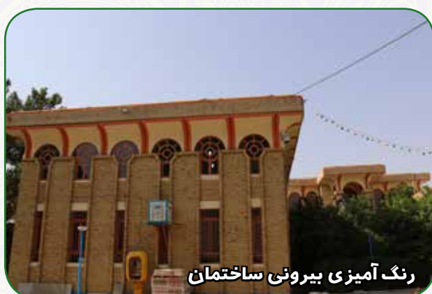
رنگ آمیزی بیرونی ساختمان