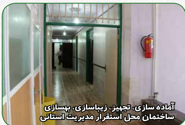
آماده سازی، تجهیز، زیباسازی، بهسازی ساختمان محل استقرار مدیریت استانی