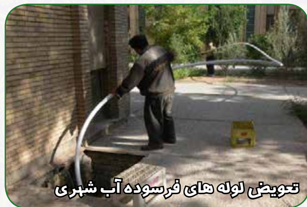
تعویض لوله های فرسوده آب شهری

تعمیرات سیستم گرمایش و سرمایش متناسب با فصل گرما و سرما