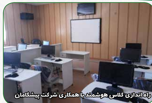
راه اندازی کلاس هوشمند با همکاری شرکت پیشگامان