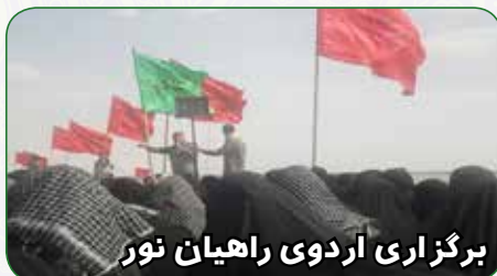
برگزاری اردوی راهیان نور