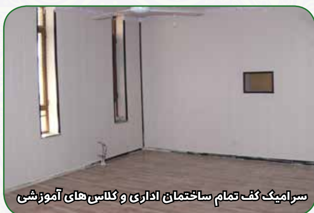
سرامیک کف تمام ساختمان اداری و کلاس های آموزشی