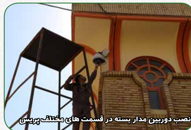
نصب دوربین مدار بسته در قسمت های مختلف پردیس