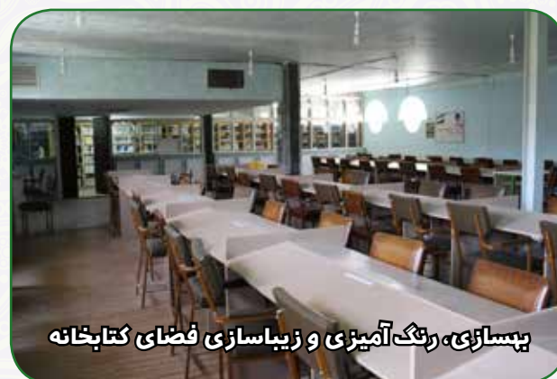
بهسازی، رنگ آمیزی و زیباسازی فضای کتابخانه