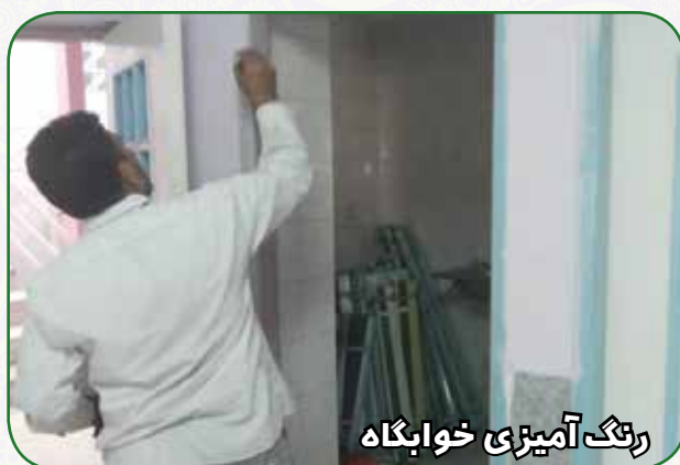
رنگ آمیزی خوابگاه