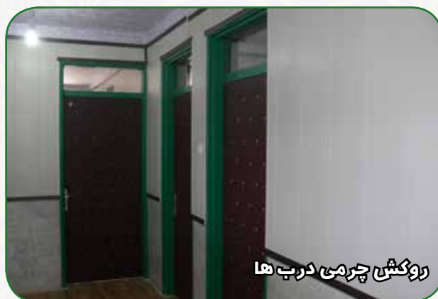
روکش چرمی درب ها