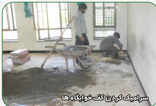
سرامیک کردن کف خوابگاه ها