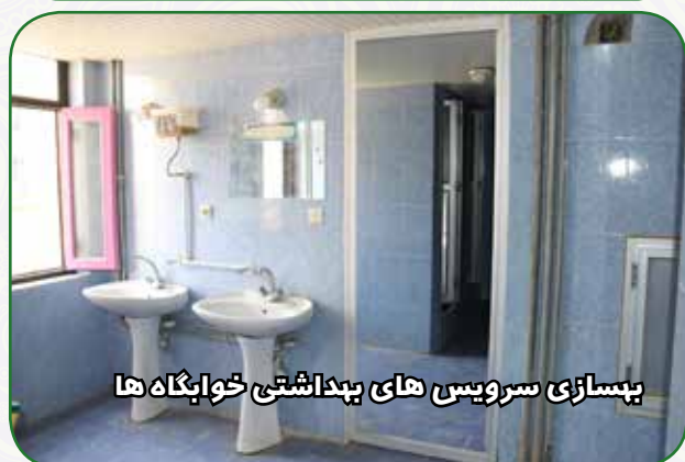
بیسازی سرویس های بهداشتی خوابگاه ها