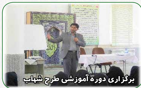
برگزاری دوره آموزشی طرح شهاب