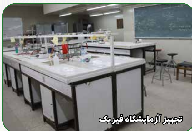
تجهیز آزمایشگاه فیزیک