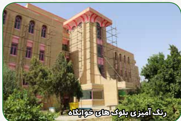
رنگ آمیزی بلوک های خوابگاه