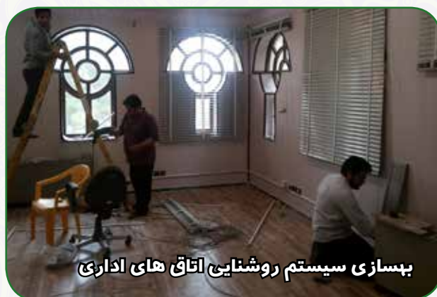
بهسازی سیستم روشنایی اتاق های اداری