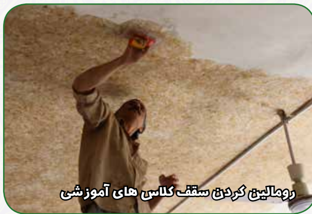
رومالین کردن سقف کلاس های آموزشی