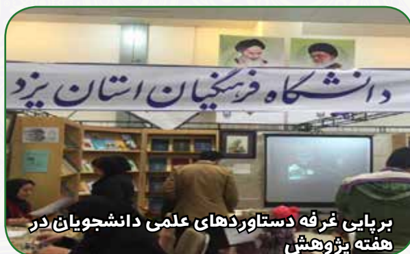
برپایی غرفه دستاوردهای علمی دانشجویان در هفته پژوهش