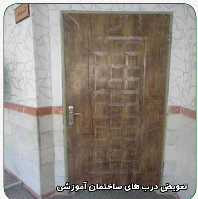
تعویض درب های ساختمان آموزشی