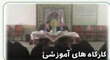
کارگاه های آموزشی