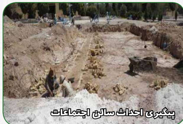
پیگیری احداث سالن اجتماعات