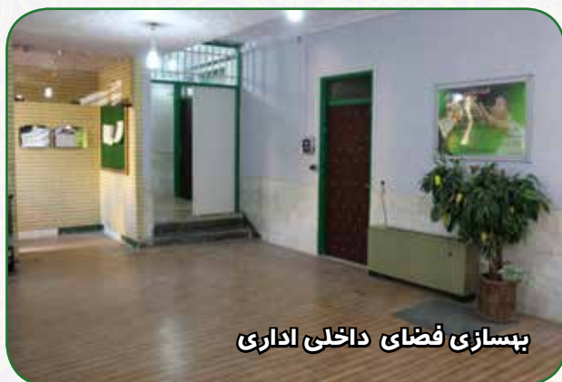
بهسازی فضای داخلی اداری