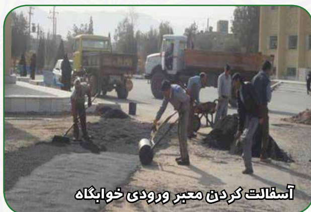
آسفالت کردن معبر ورودی خوابگاه