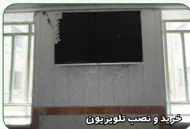
خرید و نصب تلویزیون