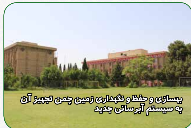
بهسازی و حفظ و نگهداری زمین چمن تجهیز آن به سیستم آبرسانی جدید