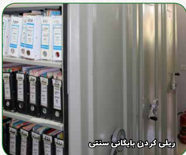
ربلی کردن بایگانی سنتی