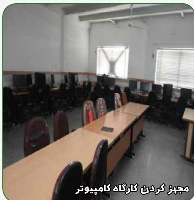
مجهز کردن کارگاه کامپیوتر