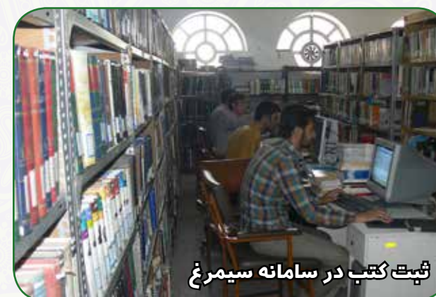
ثبت کتب در سامانه سیمرغ