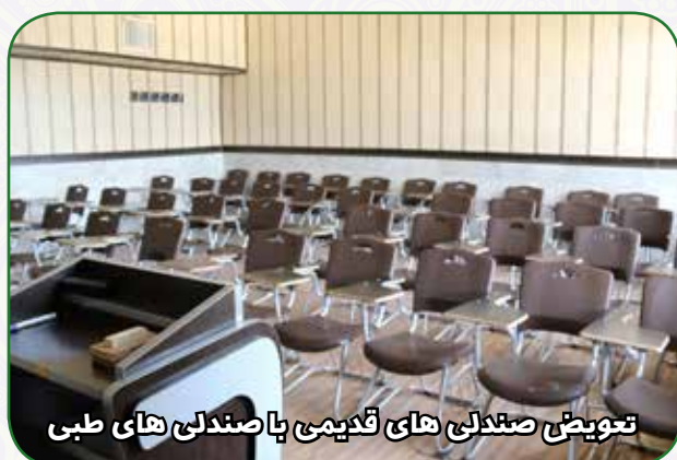
تجویض صندلی های قدیمی با صندلی های طبی