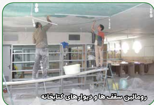
رومالین سقف ها و دیوارهای کتابخانه