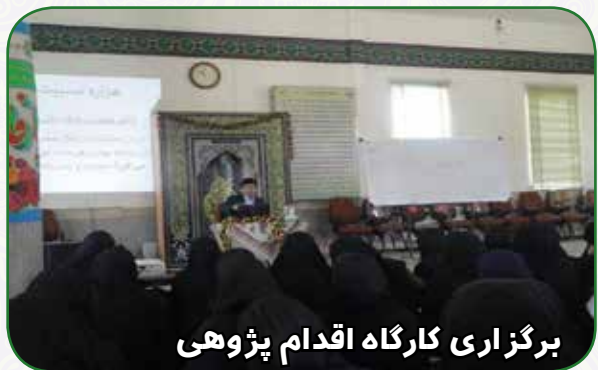
برگزاری کارگاه اقدام پژوهی