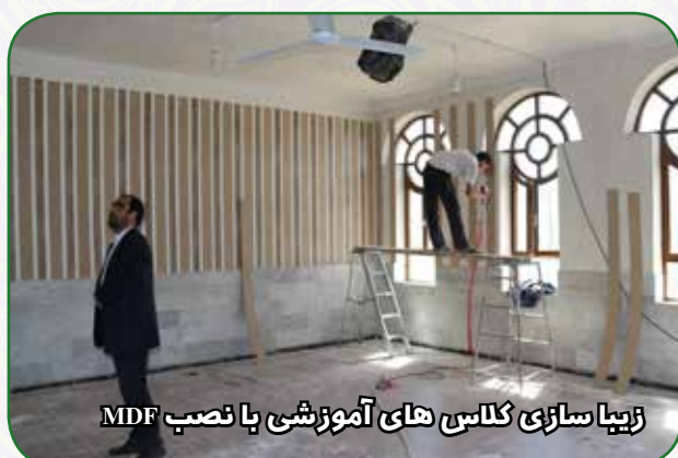
زیبا سازی کلاس های آموزشی با نصب MDF