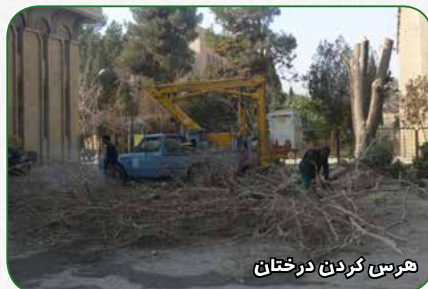
هرس کردن درختان