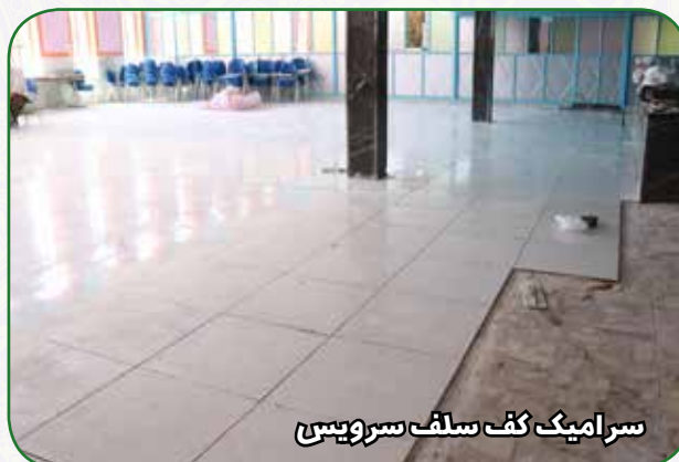
سرامیک کف سلف سرویس