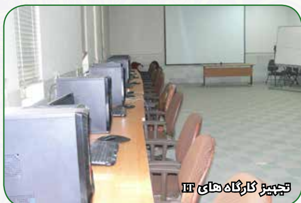
تجهیز کارگاه های IT