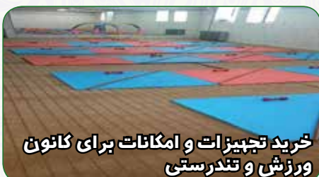
خرید تجهیزات و امکانات برای کانون ورزش و تندرستی