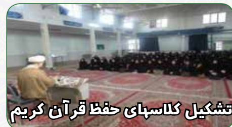
تشکیل کلاسهای حفظ قرآن کریم