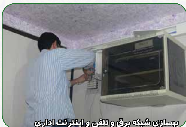
بهسازی شبکه برق و تلفن و اینترنت اداری