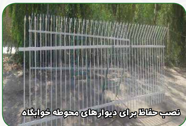
نصب حفاظ برای دیوارهای محوطه خوابگاه