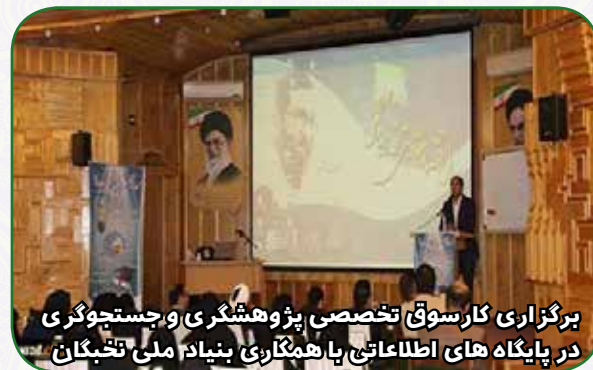
برگزاری کارسوق تخصصی پژوهشگری و جستجوگری در پایگاه های اطلاعاتی با همکاری بنیاد ملی تخنیکان