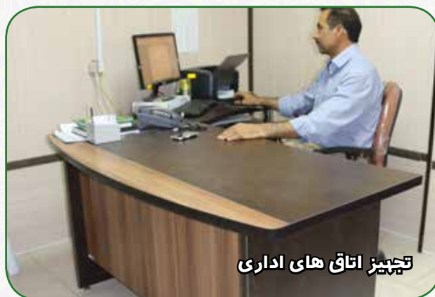
تجهیز اتاق های اداری