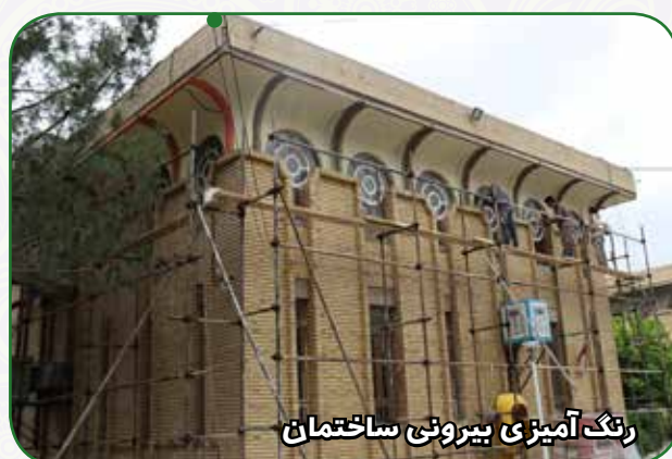
رنگ آمیزی بیرونی ساختمان