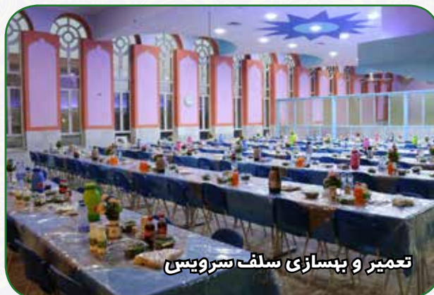
تعمیر و بهسازی سلف سرویس