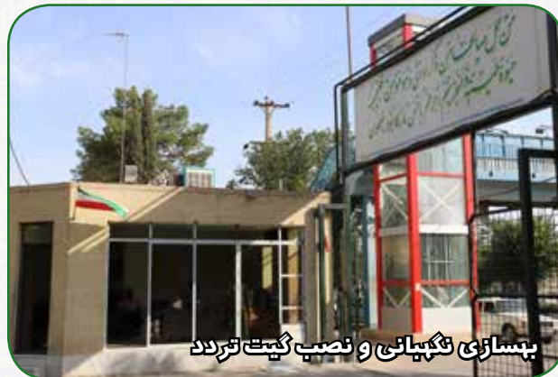
بهبودی نگهبانی و نصب گیت تردد