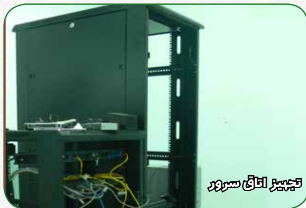
تجهیز اتاق سرور