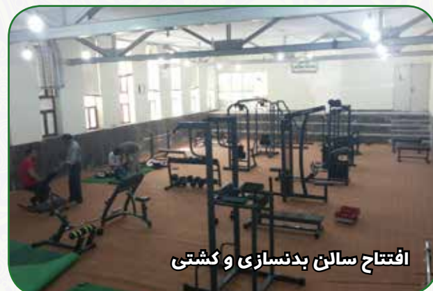
افتتاح سالن بدنسازی و کشتی