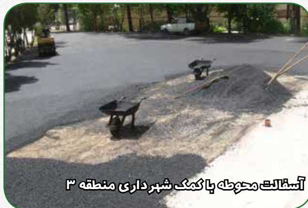
آسفالت محوطه پا کمک شهرداری منطقه ۳