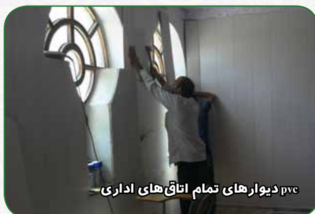
pvc دیوارهای تمام اتاق های اداری