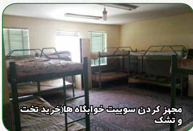
مجهز کردن سوییت خوابگاه ها (خرید تخت و تشک)