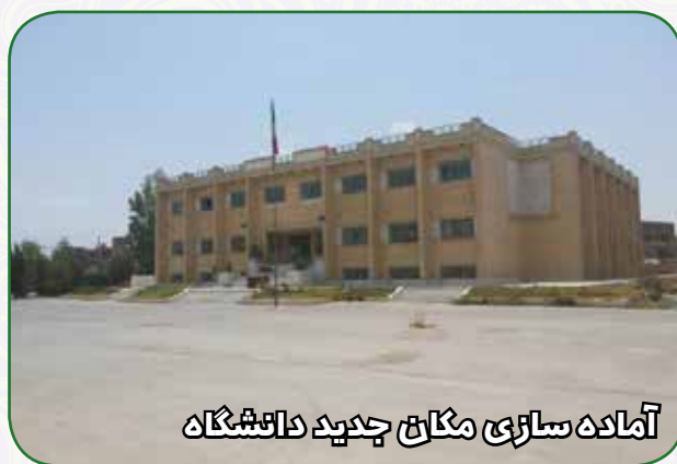
آماده سازی مکان جدید دانشگاه