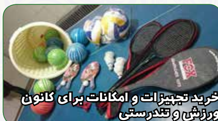
خرید تجهیزات و امکانات برای کانون ورزش و تندرستی