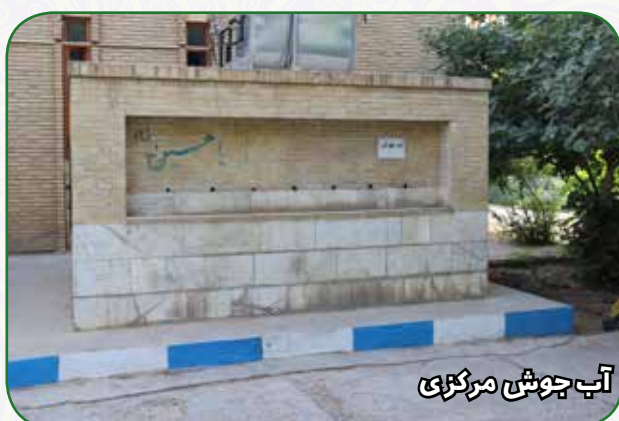
آب جوش مرکزی