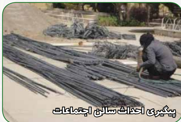
پیگیری احداث سالن اجتماعات