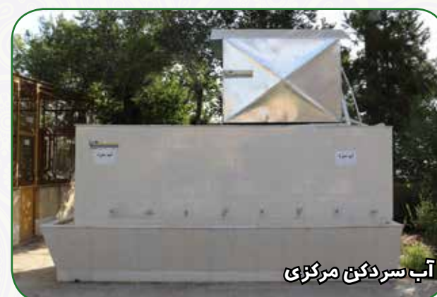
آب سردکن مرکزی