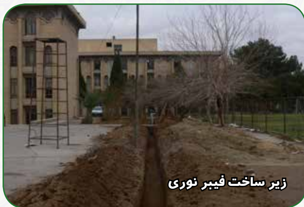
زیر ساخت فیبر نوری