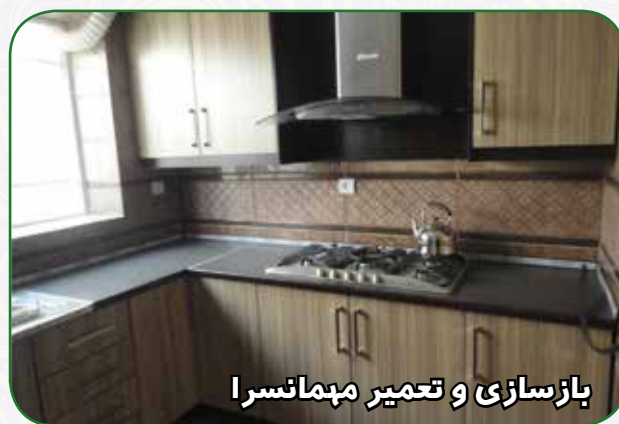
بازسازی و تعمیر مهمانسرا