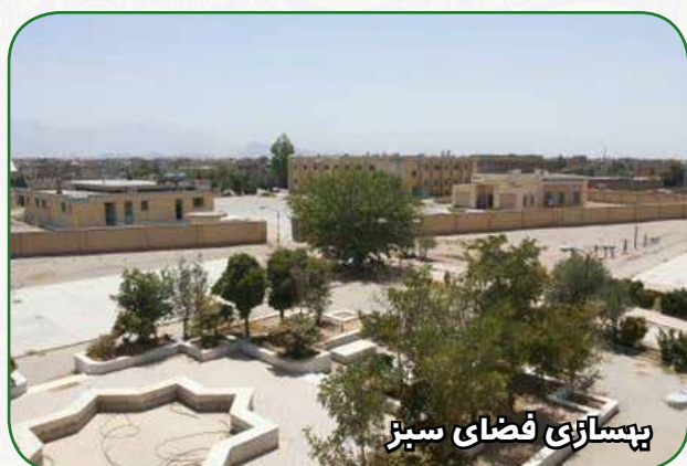
بهسازی فضای سبز