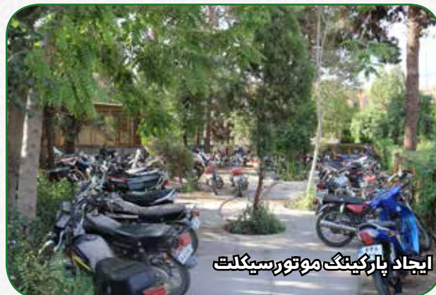
ایجاد پارکینگ موتورسیکلت

احداث فضاهای جدید برای قسمت آموزشی و فرهنگی