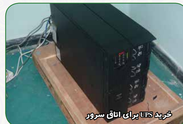
خرید UPS برای اتاق سرور