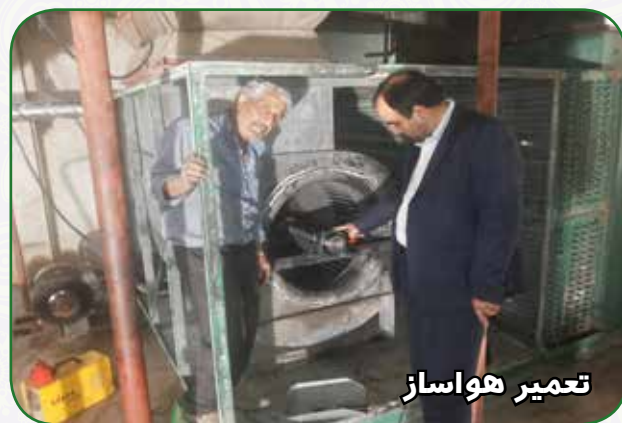
تعمیر هوا ساز