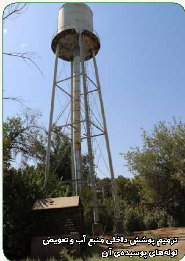
ترمیم پوشش داخلی منبع آب و تعویض لوله های پوسیده ی آن