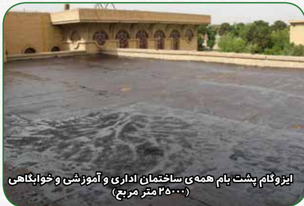
ایزوگام پشت بام همه‌ی ساختمان اداری و آموزشی و خوابگاهی (۲۵۰۰۰ متر مربع)