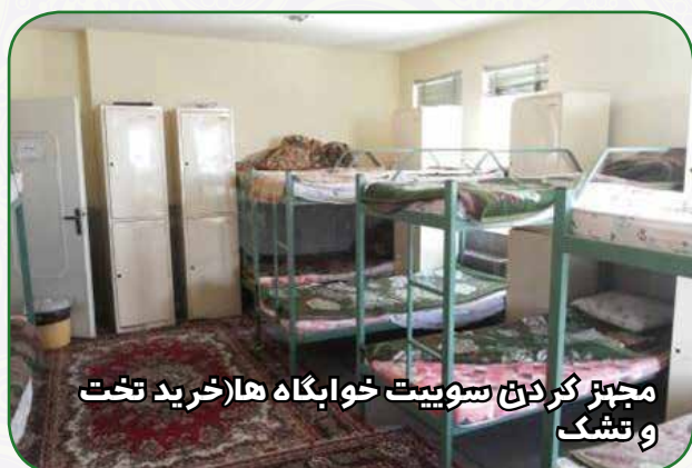
مجهز کردن سوییت خوابگاه ها (خرید تخت و تشک)