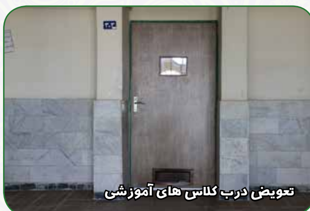
تجویض درب کلاس های آموزشی