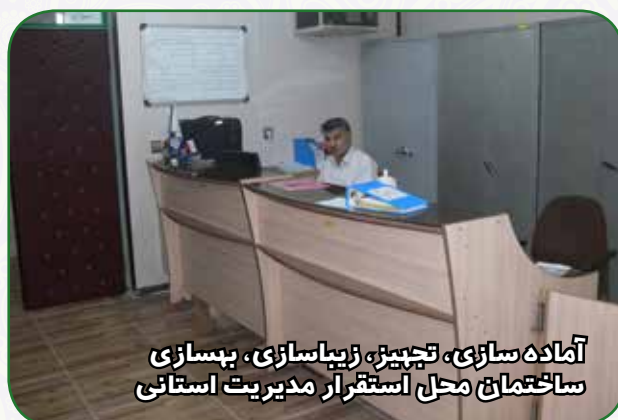
آماده سازی، تجهیز، زیباسازی، بهسازی ساختمان محل استقرار مدیریت استانی