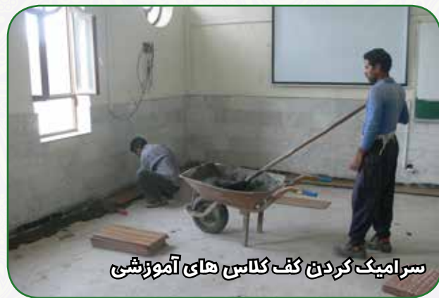
سرامیک کردن کف کلاس های آموزشی