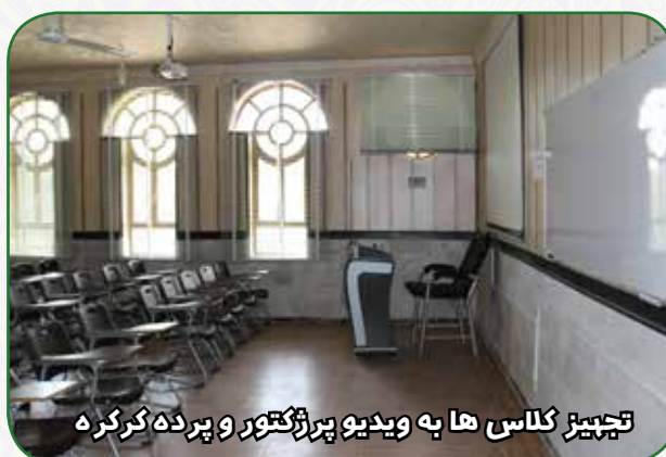
تجهیز کلاس ها به ویدیو پرژکتور و پرده کرکره