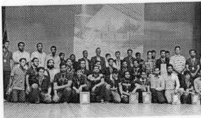
آیین اختتامیه مسابقات ریاضی دانشجویی کشور با حضور ۱۷۹ دانشجوی نخبه ریاضی در قالب ۳۹ تیم از دانشگاه‌های کشور، در دانشگاه علم و فناوری مازندران در شهرستان بهشهر برگزار شد.

مسابقات علمی در کشور، گفت: این مسابقه از قدیمی‌ترین آزمون‌های علمی کشور است که با هدف بارور ساختن استعدادها و معرفی آنان به جامعه و مجامع علمی معتبر داخلی و خارجی برگزار می‌شود.