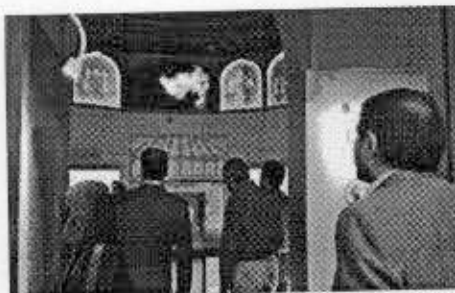
نمایندگانی از سازمان انرژی اتمی، ضمن بازدید از گالری‌های موزه ملی علوم و فناوری واقع در خیابان سی تیر، در نشستی به بررسی همکاری مشترک این دو مجموعه برای تجهیز و تکمیل گالری هسته‌ای و نور موزه علوم و فناوری پرداختند.

گالری‌های موزه حاصل همکاری مشترک میان موزه و سازمان‌ها، نهادها و شهروندان دغدغه‌مند در موضوعات علمی است، گفت: گالری انرژی‌های نو که در سال ۹۴ افتتاح شد، حاصل همکاری مشترک میان موزه علوم و سازمان انرژی اتمی بود.